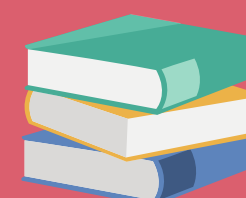
Le temps des histoires