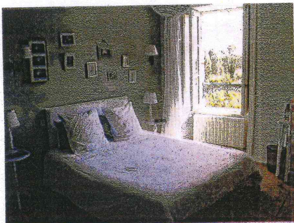
L'une des quatre chambres d'hôtes du presbytère

4 Place Abbé Damon à Erbrée. Contact : 06 18 37 54 82, contact@au-presbytere-de-dagmar.fr .