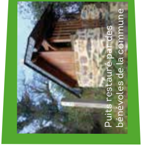
Puits restauré par des bénévoles de la commune