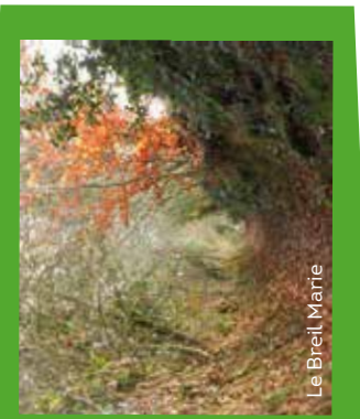
Le Breil Marie

7,3 km dont 3,350 km de route, balisé dans le sens des aiguilles d'une montre.